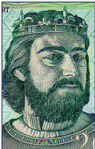
I. Károly király fiktív arcképe az egykori 200 forintos bankjegyén

Hűségről vagy hűtlenségről rendszerint szolgálakat neveztek el. A nemesekre vagy más előkelő származásúakra inkább a „hűtlen” vagy a „lázado” jelzőkkel utaltak. Például ingadozó magatartása miatt Csák Máté, aki először hűséget fogadott Károly Róbertnek (I. Károly királynak), utána mégis szembeszállt vele: hűtlen és lázado megbélyegzést kapott. Hasonlóan ambivalens magatartást tanúsított, de többnyire hűtlenként és lázadóként vált ismertté Kán [Keán] László erdélyi vajda, a Kőszegiek stb., vagyis a XIV. század kiskirályainak, modernebb kifejezéssel: tartományurainak, oligarcháinak egy része. Mindezt tetézte az