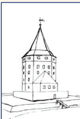
A nyárasapáti kúria rajza Balanyi Béla (1963) feltárása nyomán

zátartozó szintén vitézlő címet szerzett, mégpedig: Mende utolsó Nyárasapáti nevű birtokosának, III. Klárának, Nyárasapáti György lányának a fia, András. Igaz, ő már az apja nevét, a Kussaly Jakchy nevet viselte. Szatmár és Belső-Szolnok vármegye patinás családjának a sarja volt. Nyárasapáti III. Klára hiába adta el korábbi birtokait, köztük Mendét is, a keletre költözése nem hozott számára nyugalmat, mert a vitézlő (egregius) fia állandó pénzzavarral küzdött. Egyik követte a másikat, ezért birtokainak egy részét zálogba kellett adni, illetve mivel nem tudta visszaváltani, elveszítette azokat. Több okirat adományozásról és perlekedésről szól.