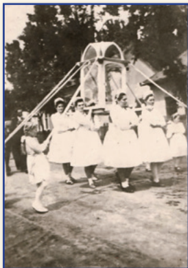
Máriás lányok a hordozható Mária-szoborral

A szerzetesrendek, mindenekelőtt a jezsuiták és a ferencesek Jézus anyjának, Máriának a személyét törökellenes szimbólummá emelték. A török idők elmúltával és polemikus jelleggel, a reformáció ellensúlyozására a katolikusok körében a „harcos” szentek tisztelete, valamint a Mária-tisztelet, a Mária-kultusz vált a legfőbb fegyverré, és vívott ki magának szokatlanul nagy presztízt.