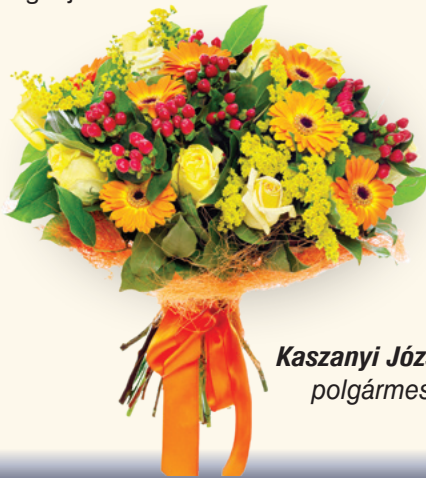
Kaszanyi József polgármester

2024. június 9-én Európa Parlamenti és önkormányzati választások lesznek. Kérem, mindenki éljen választójogával és menjen el szavazni! Az újság belső hasábjain további információkat tudhatnak meg a jelöltekről.