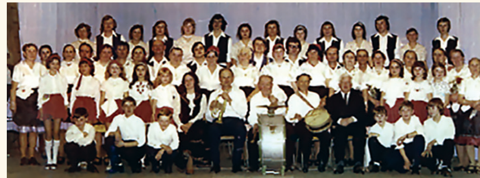
A Mendei Hagymányőrző Népi Együttes 1976-ban

Ezért megalakulása után pár hónappal, de még 1976-ban felvette a Mendei Hagymányőrző Népi Együttes nevet.