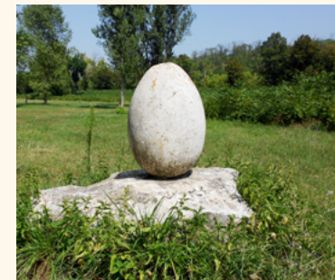
A kőtojás a Vincellérvölgyben

A Granárium és a 31-es országút között földút vezet a kb. 1,5 km-re fekvő Vincellérvölgybe. Nevét a XIX. században kialakított szőlőművelés emlékére kapta. A név maradt, a szőlőtermesztés azonban rég megszűnt. Ehelyett egy kőtojással gazdagodott, amelyet Bille északi részén elterülő Tűzberekről mentettek ide. A kőtojás nemcsak a mendeiek, hanem a gyömrőiek kedvelt uticélja. [Visszafelé az állomás érintésével a Fehérhegyen lévő Mende Kilátóhoz jutunk, ahonnan gyönyörű panoráma nyílik a hét domb völgyében elterülő falura.]