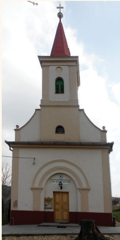
A mendei evangélikus templom homlokzata

A gyülekezet ma is működő templomának tervrajzát és költségvetését Kassalik Ferenc készítette 1829-ben. Az építményt 1832 adventjében szentelték fel – egyes adatok szerint advent második vasárnapján. A templom zárt helyen található. 7,5 öl hosszú és 4,5 öl széles. Egytornyos, klasszicista stílusú, mintegy 150 + karzaton 20 hívő befogadására alkalmas téglapítmény, tornyán kereszttel. Sekrestyéje nincs. Főbejárata nyugat felé néz. Ajtaja fölött félköríves falmező látható. A kórusa a torony első emeletén az oltárral szemben helyezkedik el. Rajta eredeti orgona, amely a rákoskeresztúri evangélikus templomból származik; vélhetően 1648-ban készült, és 1858-ban került a gyülekezethez. A torony második emeletén 3 harang lakik, a legrégebbi 1823-ban Eberhardt Henrik műhelyében öntetett, a másik 1922-től, a legkisebb pedig 1988-ban történt újraöntésétől szolgálja a gyülekezetet.