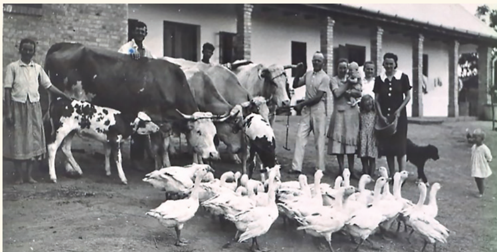
Kép: Badacsonyi család

lehetőségeket, ami hatással volt az öltözködési-viseleti szokásokra. Újabb öltözködési szokások az 1920-as években, valamint az 1950-es években jelentek meg. Az 1920 körüli változás főként a menyasszonyi ruhákat és a selyemruhák elterjedését, az 1950-es éveké pedig a teljes helyi népviseletet érintette. Napjainkban mendei népviselet helyett inkább népies viseletről illene beszélni, amely részben a múlt öltözködési szokásainak visszaidézésén, a tetszetős környékbeli viseletek beépítésén, illetve egyéni ízléseken alapuló, különböző mértékű kompozíció. A népviseletben tapasztalható változások legjobban az azonos vagy hasonló típusú rendezvények öltözködési szokásaiban mutathatók ki. Mintaként vegyük a szüreti felvonulók öltözeteit 100 év különbséggel. Ami szembetűnik, hogy 1922-ben valamennyi férfi kalapot, hosszú ujjú fehér inget, fekete mellényt, bő szárú fehér kenderből készült bőgatyát, valamint fekete cipőt vagy keményszárú fekete magyar csizmát viselt. A lányok többsége pedig hajadonfővel, magyaros öltözetben, köténnyel, fekete, félmagas sarkú fűzős lábbeliben vagy fekete félcipőben, kezükben slingeléssel díszített kézikendővel látható. Mások a fehér blúzok vagy keményített bugyuk fölött szaténból készült kendőt vetettek keresztbe.