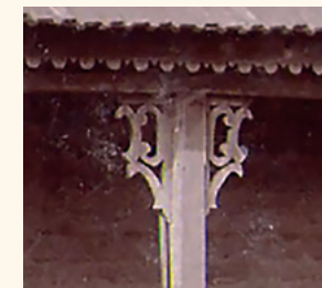
Kép: Bagoly Mária

A másik önálló művészeti tevékenység, a kerámiakészítés a faluban nem tekint hosszabb múltra, bár a téglagyár bizonyítja, hogy megfelelő minőségű agyag állt rendelkezésre. A kerámiakészítést Albrecht Júlia neve