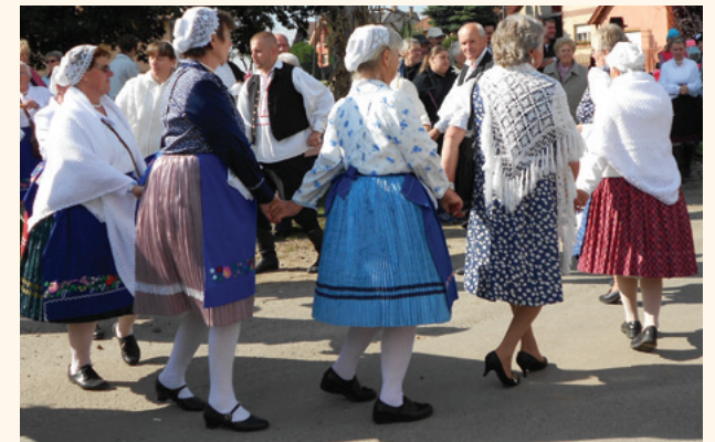
Hagyományon és egyéni ízlésen alapuló mendei népies viselet

Az 1880-as évektől megjelentek a háziiparosok (előtte nem működött iparos Mendén), illetve az 1882-ben átadott vasút kitérítette a horizontot, módosította a közlekedési-utazási