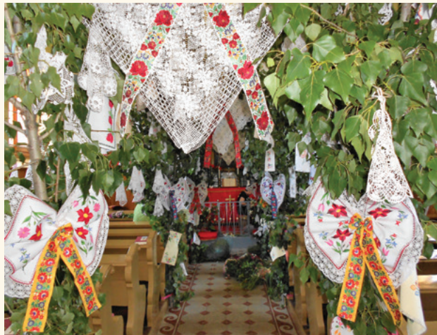
Pünkösdi templomdíszítés a mendei evangélikus templomban

A népi vallásosság a májusfaállítás magába építette és bevitte a templomba. Minthogy az időpont egybeesett a keresztény pünkösdi hónapjával, ezért a népi gondolatvilág a kettőt összekapcsolta. Innen már csak egy lépés