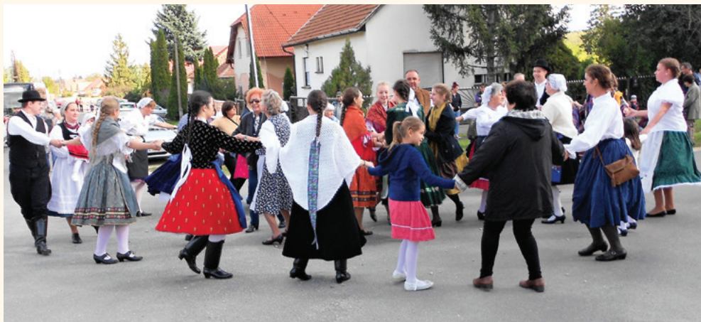
Népviselőbe öltözött felvonulók tánca a Tanyákon