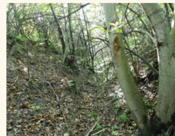
Az I. Attila-vonal tankárka

Ha az állomás helyett átkelve a 31-es országúton és a Barina-patak mentén haladunk, a Csikós tanya fölött a Várhegy aljába jutunk. A Kratyinka-ér két oldalán helyezkedik el az 1848-1849-es háborús emlékekben gazdag Katonavölgy, illetve az egykori Billei Leányvárral szinte egyvonalban balról fut bele a Malomvölgy, amelyet Evlia Cselebi 1660-ban a törökök számára életveszélyes helyként említett. A Katonavölgy végénél jobbra található a Kratyinka, melynek keleti lejtőjéig értek az I. Attila-vonal tankárcái, ahol fel kellett volna tartóztatni az előre nyomuló szovjet hadsereget. A